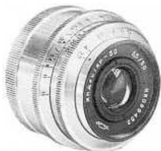
Индустар-50 для дальномерных камер