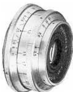
Индустар-50 для зеркальных камер