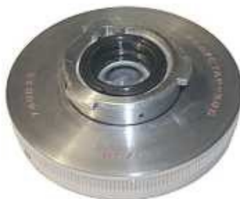
Индустар-50С для медицинских фотокамер