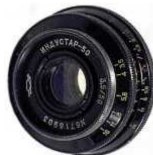
Индустар-50 1980-х годов выпуска