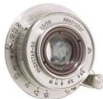
Индустар-50 производства ЛЗОС